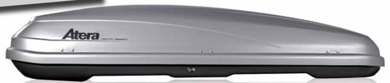
Atera, Thule oder Hapro