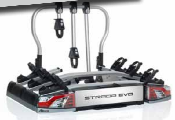
Atera, Eufab oder Thule