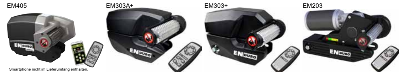
Smartphone nicht im Lieferumfang enthalten.