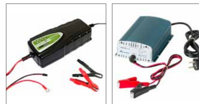
ENDUROAS1210 Ladegerät Xenteq LBC Serie